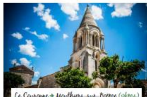
La Couronne → Mouthiers-sur-Boëme (9kms)

Saint-Michel : Du « blanc manteau d'églises » dont la campagne charentaise se dota au Moyen-Âge, Saint-Michel est pour de nombreuses raisons exceptionnelle. Fondée par la puissante abbaye Notre Dame de La Couronne en 1137 pour accueillir les pèlerins en route vers de saints sanctuaires dont celui de Saint-Jacques de Compostelle elle adopta un des rares plans octogonaux de la région.