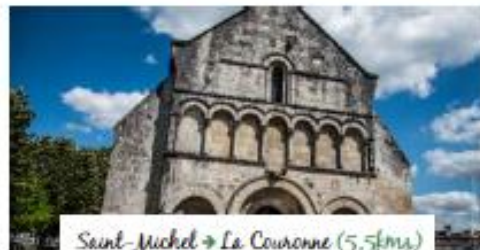
Saint-Michel → La Couronne (5,5kms)

La Couronne : Grâce à une importante campagne de travaux de restauration menée par les Compagnons de Saint-Jacques, l'église Saint-Jean a retrouvé son lustre d'antan. Un clocher polygonal à flèche à écailles de pierre coiffe un vaste édifice en croix latine qui s'achève à l'ouest par une façade à arcatures dont le décor rappelle celui de la cathédrale Saint-Pierre.