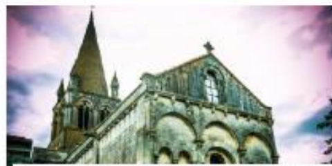
Plassac-Rouffiac → Roulet-Saint-Estèphe (10kms)

Vougezac : Classée Monument Historique en 1903 et en cours de restauration, l'église Notre-Dame est agréablement située au cœur du bourg. Son architecture défensive, bien visible à l'extérieur, rappelle son rôle de protection des populations pendant les périodes de troubles et notamment les guerres de cent ans qui ravagèrent la région au cours du XIV e siècle.