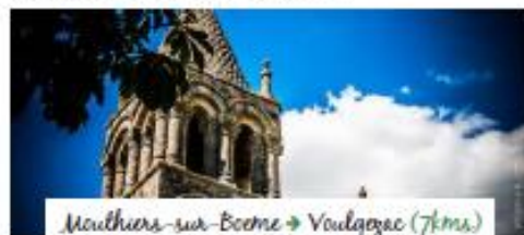
Mouthiers-sur-Boëme → Vougezac (7kms)

La Couronne : Grâce à une importante campagne de travaux de restauration menée par les Compagnons de Saint-Jacques, l'église Saint-Jean a retrouvé son lustre d'antan. Un clocher polygonal à flèche à écailles de pierre coiffe un vaste édifice en croix latine qui s'achève à l'ouest par une façade à arcatures dont le décor rappelle celui de la cathédrale Saint-Pierre.