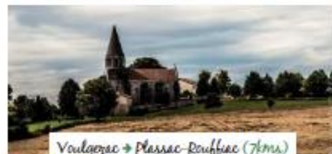
Vougezac → Plassac-Rouffiac (7kms)

Mouthiers-sur-Boëme : Le bourg pittoresque, bordé par la Boëme, qui sert d'écrin à l'église Saint-Hilaire est né d'un « moustier » fondé au XI e siècle. L'église datée des XI e et XII e siècles fut remaniée aux XIII e et XV e siècles. Le clocher gothique ajouré d'arcs trilobés domine cette jolie cité de caractère.